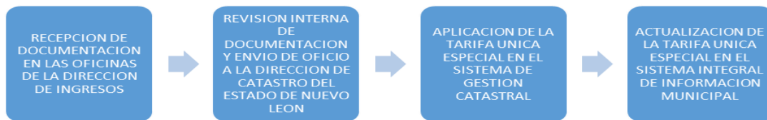
DIAGRAMA DEL PROCESO DEL TRÁMITE

OBSERVACIONES : UNA VEZ REUNIDOS LOS REQUISITOS SE ENVIARÁ EL EXPEDIENTE A LA DIRECCIÓN DE CATASTRO DEL ESTADO DE NUEVO LEÓN, PARA QUE AUTORICE O RECHACE LA TARIFA ESPECIAL.