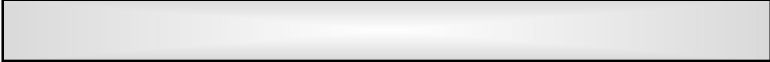
DIAGRAMA DEL PROCESO DEL TRÁMITE