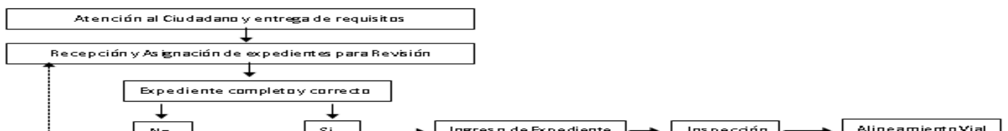
DIAGRAMA DEL PROCESO DEL TRÁMITE

OBSERVACIONES : APLICA PARA TRAMITES MENORES CONSTANCIA DE TERMINACION DE OBRAS